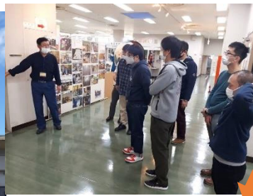
職員からの説明を受ける