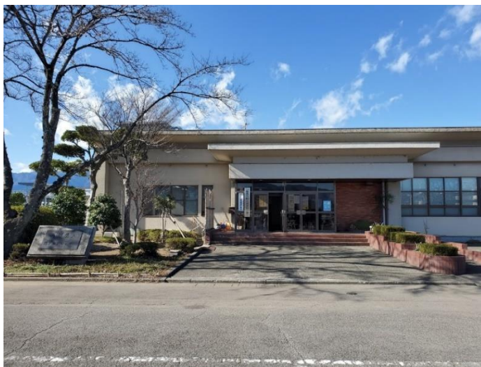
山梨県立防災安全センター玄関

防災の取り組みとして、11月28日(土)、 「山梨県立防災安全センター」へ訪問しました！